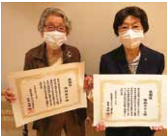
受賞されたお二人