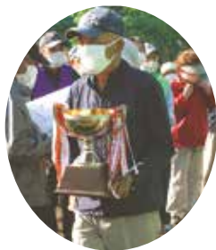
優勝した油面ときわ会