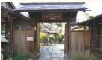
宮野古民家自然園