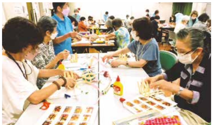
各テーブルごとに 一生懸命作成