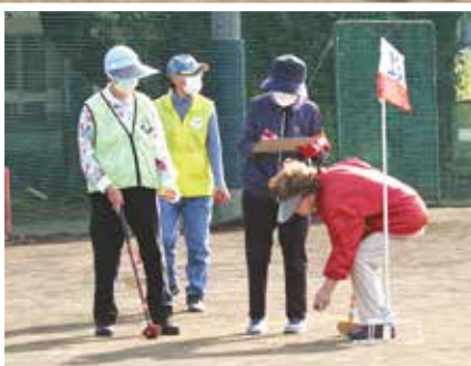
スコア記入も忘れずに

しかし成績発表の頃には笑顔が戻り、表彰されたチームには温かく拍手を送っていました。今回実力を発揮できなかった選手の皆様も、次回の大会でも優勝目指して頑張ってください。