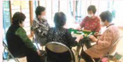
麻雀で脳を活性化

昭和56年、日向桜寿会として菅刈老人いこの家を基盤にして活動しています（後に桜寿会に改名）。従来の活動(手芸・麻雀・手ぬぐい体操など)に新しくボッチャや絵手紙・DVD鑑賞を活動に加えて、週8回のペースで会員の皆様と楽しい時間を共有しています。 コロナ感染も終息しつつありますので、誕生会・歩こう会も秋には実施したいと思えます。会員の皆様の生きがいづくりと健康づくりに少しでも役に立ちますように努めていきたいと思えます。