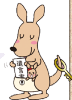
公式キャラクター ほカンガルー