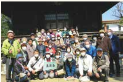
円融寺釈迦堂前での記念写真

(室町期)が祀られ、「碑文谷」 の地名の由来とされています。 ◆釈迦堂は都区内最古の木造 建築、数奇な変遷、円融寺 碑文谷八幡から立会川緑道 と続く桜並木をゆっくり散歩 すること数分。左手奥に円融 寺の山門が見えてきます。 最澄の高弟円仁の創建(平 安期)と伝えられる円融寺は 東京でも屈指の古刹ですが、 創建以来数奇な変遷をたどっ ています。鎌倉期の天台宗か ら日蓮宗への改宗と発展(碑 文谷法華寺)。不受不施派と して幕府から弾圧を受け、天