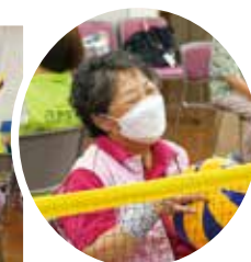
思わずこぼれる笑顔