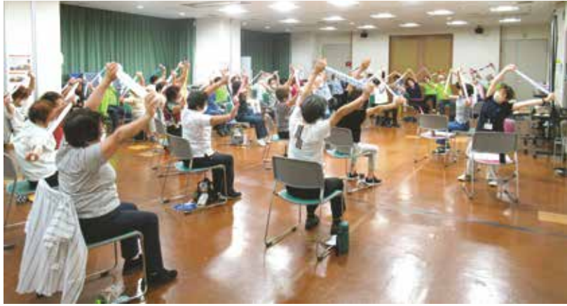
椅子に座ってできる体操です