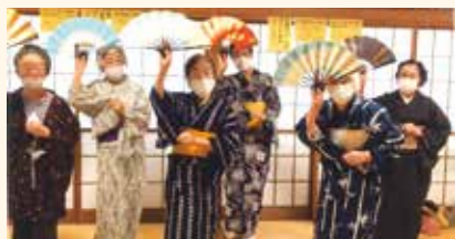
大舞台のために腕を磨きます