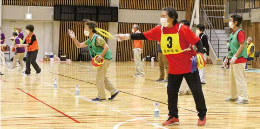
各レーンで熱戦展開