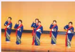
お揃いの着物で踊ります

コロナも収束が近いと思いますので、役員会において各部長が新しい仲間を増やしてクラブを憩いの場として発展させることを目標にしています。