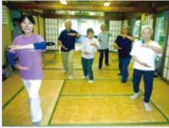
太極拳で健康を実感

クラブでは生き生きと体操・太極拳・習字・カラオケ・コーラス・ボランティアの切手整理を行なっています。 中でも太極拳は易しい動作を先生が指導してくださいますので、皆で楽しく行っています。ゆったりと身体を動かす動作は、とても気持ち良く身体全体がほぐれてとても楽しくなり、幸福な気分になります。そしてその日の夕食がとても美味しいです。何よりも夜ぐっすりとお眠ることができ、健康のためには太極拳が一番だと実感しています。